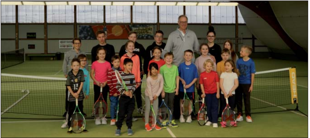
Die Teilnehmer beim diesjährigen Lion's-Cup